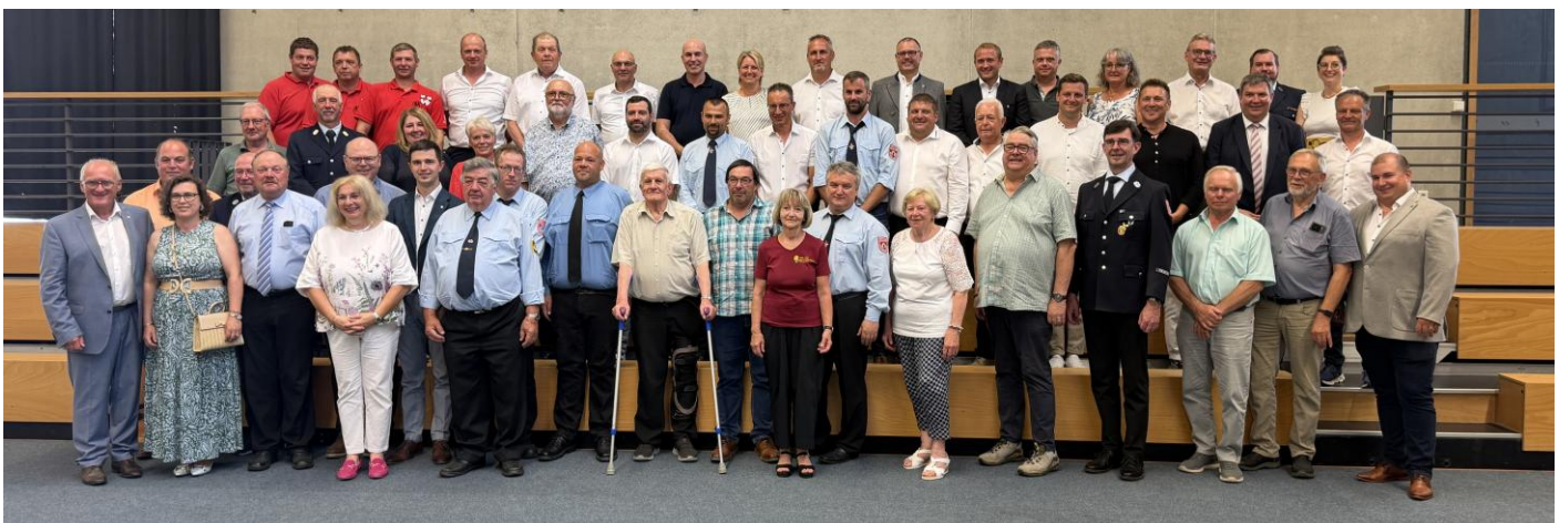
Alle geehrten Personen des Abends beim Gruppenbild

Schnitzel mit Beilagen bot sich die Gelegenheit zu zahlreichen Gesprächen und Begegnungen. In geselliger Atmosphäre ließen die Anwesenden den Abend ausklingen und waren sich einig, dass der Ehrenamtstag erneut eine gelungene Würdigung des vielfältigen ehrenamtlichen Engagements in der Gemeinde Buttenwiesen war.