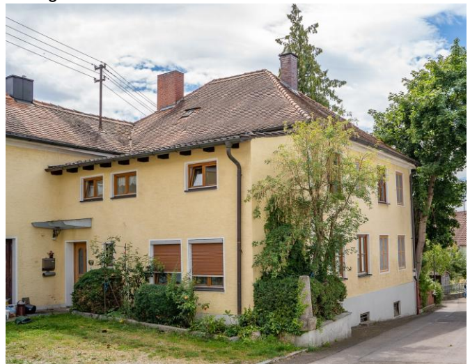
Foto: Schulgebäude der ehem. jüdischen Volksschule Buttenwiesen in der Geistbergstraße.

Wie an jedem letzten Sonntag des Monats ist das jüdische Ensemble am Louis-Lamm-Platz in Buttenwiesen auch an diesem Tag von 14:00 bis 17:00 Uhr geöffnet. Der jüdische Friedhof, das begehbare Denkmal Mikwe Buttenwiesen und die Ausstellung „Eine Pforte des Himmels mitten im Ort“ in der ehem. Synagoge können besichtigt werden.