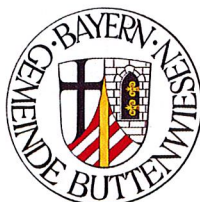
Gudrun Bentele Bauamt

Ortsüblich bekannt gemacht durch Anschlag an den Amtstafeln der Gemeinde Buttenwiesen. Gleichzeitig veröffentlicht auf der Homepage der Gemeinde Buttenwiesen ( https://buttenwiesen.de/buergerservice/#buergerservice_amtliche_bekanntmachungen ).