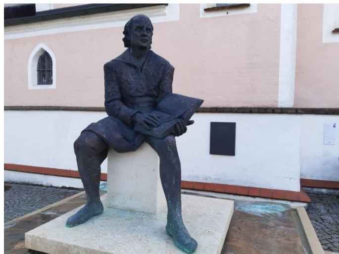
Direkt vor der Unterthürheimer Kirche erinnert der Ulrich-von-Thürheim-Brunnen an den mittelalterlichen Dichter.

Der Heimatverein Unteres Zusamtal lädt alle Interessierten zu diesem Vortrag am Montag, 3. November, um 19.00 Uhr im Zehentstadel Pfaffenhofen (Sylvesterstr. 17) ein. Der Eintritt ist frei. Eine Voranmeldung ist nicht erforderlich.