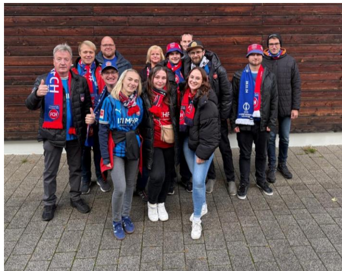
Die Heidenheim Fans auf ihrer Auswärtsfahrt

Weitere Einblicke ins Vereinsleben gibt es auch auf Instagram unter: @rotblau_thuerheim