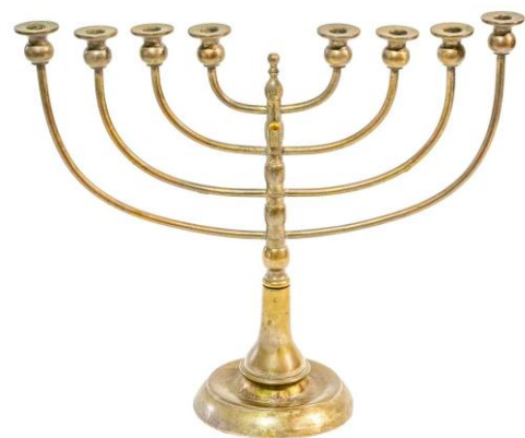
Der von Louis Lamm vertriebene Chanukka-Leuchter gehört zu den Glanzstücken der Bavarikon-Ausstellung „Das jüdische Erbe Bay.-Schwabens“.

Wie an jedem letzten Sonntag ist das jüdische Ensemble am Louis-Lamm-Platz in Buttenwiesens auch am 28. September von 14 bis 17 Uhr geöffnet. Der jüdische Friedhof, das begehbare Denkmal Mikwe Buttenwiesens und die Ausstellung „Eine Pforte des Himmels mitten im Ort“ in der ehem. Synagoge können besichtigt werden. An allen Stationen geben ehrenamtliche Helferinnen und Helfer auf Nachfrage Hintergrundinformationen.