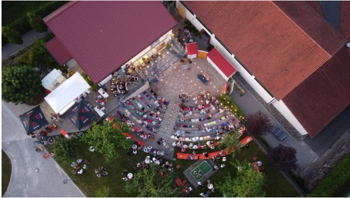
das Amphitheater Unterthürheim von oben

„heid gommer of Dürre, do isch was los“, hieß es kürzlich in Unterthürheim. Mit vier ausverkauften Abenden und einem begeisterten Publikum feierte der Hurga Club in diesem Sommer einen bemerkenswerten Erfolg: Die diesjährige Freilufttheater-Reihe wurde zu einem der kulturellen Höhepunkte der Saison und zeigt eindrucksvoll, wie lebendig und kraftvoll Theater unter freiem Himmel sein kann.