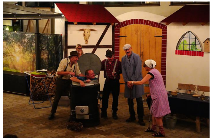
der zweite Einakter „das G'ständnis im Kartoffeldämpfer“