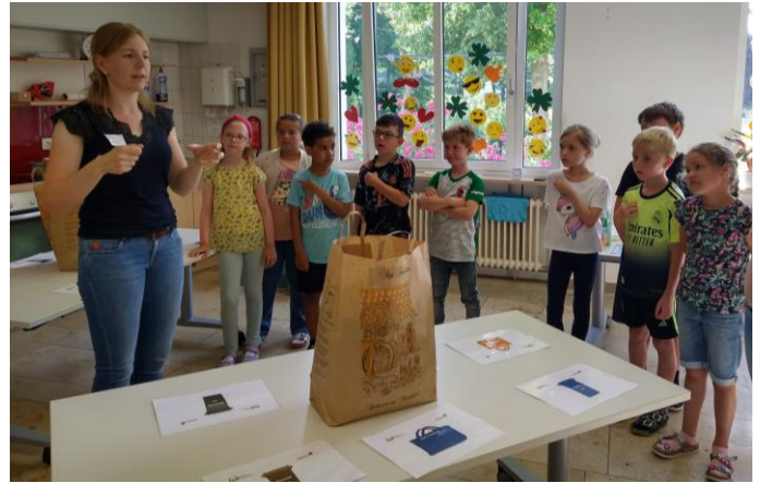
Die Zweitklässler hören gespannt zu wie sie zuhause mithelfen können, Text: Daniela Lang

Die jungen Teilnehmer zeigten dabei großes Interesse und viel Eifer.