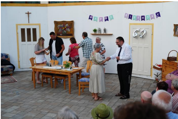
das erste Stück: „man wird nur einmal 60“

Angesichts des Erfolgs hat sich der Hurga Club in diesem Jahr um den Denzel-Theaterpreis beworben. Mit seinem Engagement für Freiluftkultur und seine kreative Umsetzung möchte der Verein ein Zeichen für lebendige Theatertradition setzen – nahbar, gemeinschaftlich und mitreißend.