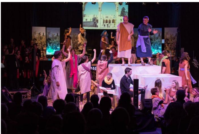
Bild: Szene aus dem Musical Rut

Zu unserem Jubiläum haben wir zwei besondere Highlights geplant. Am 12. Oktober 2024 um 17:00 Uhr feiern wir mit unserer großen Jubiläumsveranstaltung „20 Jahre Musicalprojekt86 – eine Zeitreise“ in der Gemeindehalle Buttenwiesen und nehmen unser Publikum mit auf eine musikalische Reise durch zwei Jahrzehnte voller Bühnenmagie. Und weil Theater bei uns nicht fehlen darf, präsentieren wir Anfang des neuen Jahres das