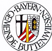
Gudrun Bentele Bauamt

Gemeinde Buttenwiesen Buttenwiesen, den 21.03.2025