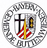
Gudrun Bentele Bauamt

Gemeinde Buttenwiesen Buttenwiesen, den 21.02.2025