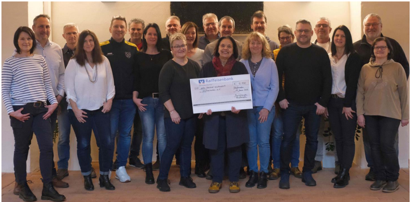
Die Musikfreunde Pfaffenhofen bei der Spendenübergabe an Glühwürmchen e.V.

Die Musikfreunde bedanken sich bei allen Musikern, Helfern, Unterstützern, bei der Showtanzgruppe " Dance Explosion" und beim Fischereiverein Pfaffenhofen für ihr Engagement für diesen guten Zweck. Wiederholung garantiert !