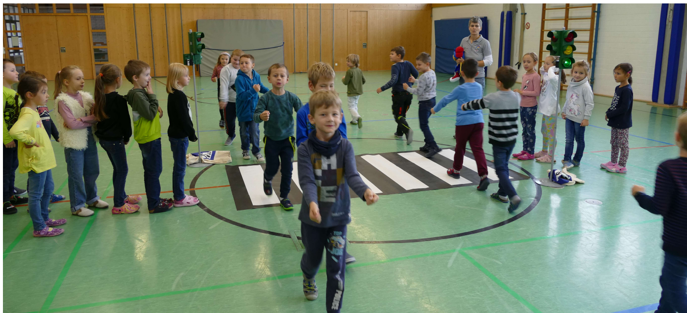
Die Klasse 1b freut sich mit dem Verkehrsraben „Adacus“ über die gelungene Unterrichtseinheit - Bild 1b - Krause Sybille

Als Dankeschön erhielt jedes Kind eine Urkunde und einen Aufkleber.