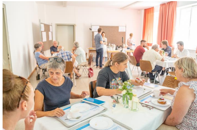
Probelauf des Lernortcafés – „Café Einhorn“ – in der ehemaligen Synagoge mit Einweisung zu den verschiedenen Gedecken