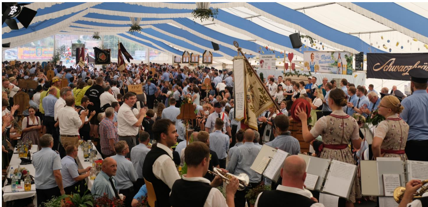
Fahneinzug beim Feuerwehrfest Lauterbach