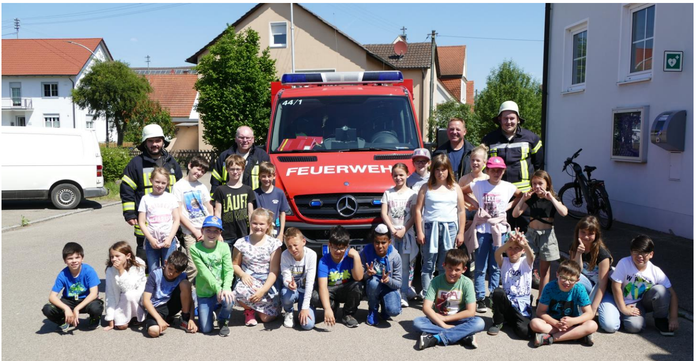
Bildunterschrift: Die Klasse 3c der Ulrich-von-Thürheim-Grundschule beim Besuch der Freiwilligen Feuerwehr Pfaffenhofen

Doch nicht nur die riesige Flamme „brannte“ sich in die Köpfe der Kinder ein. Viele weitere interessante und wissenswerte Dinge, die die drei dritten Klassen an diesem Tag von der Feuerwehr Pfaffenhofen lernen durften, werden die Mädchen und Jungen immer an diesen Tag zurückerinnern.