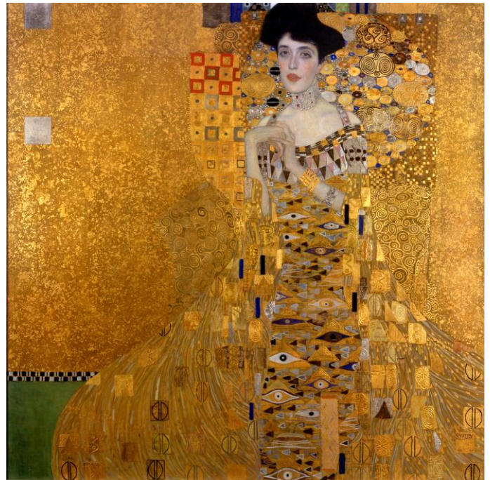
„Die Goldene Frau“ ist Adele Bloch-Bauer