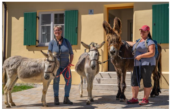
Beim zweiten Themensonntag war das jüdische Ensemble Ziel einer Eselswanderung von „Teamwalk Lauterbach“ mit Frau Schuler. Hier posieren die Grautiere vor der Mikwe während die Eselsführer mit einer Themenführung unterwegs sind