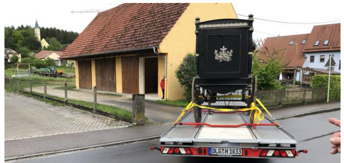
Umzug des historischen Leichenwagens ins Außenlager nach Frauenstetten

Am Sonntag, den 16.10.2022 von 14.00 bis 16.00 Uhr wird das neue Depot geöffnet und zur Besichtigung freigegeben. Die gesamte Bevölkerung ist herzlich eingeladen.