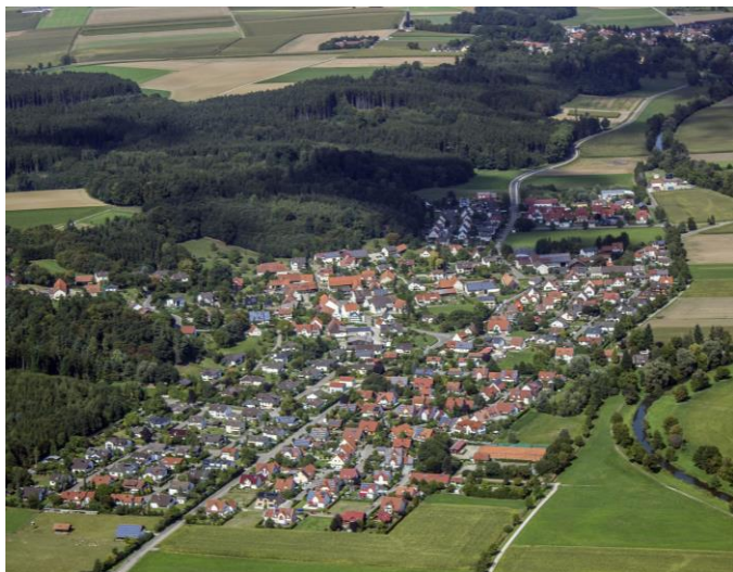
Kühleenthal aus der Luft

Die Kinder des Ortes werden im gemeindlichen Kindergarten Wichtelburg betreut und gemeinsam mit der Gemeinde Westendorf wird der Schulverband Grundschule Westendorf unterhalten, der der Sachaufwandsträger für die Grundschule in Westendorf bildet. Wie aus vielen Nachbargemeinden zu hören ist, ist auch in unserer Gemeinde der Bedarf an Betreuungsangeboten für Kinder ständig zu erweitern. So hat sich die Gemeinde entschlossen, eine Erweiterung des Kindergartens zu planen.