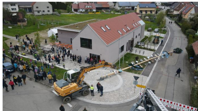
Impressionen beim Maibaumaufstellen, Bild: Gemeinde Kühleenthal

Die Aktivität der Vereine erhöht die Freizeitmöglichkeiten immens. So bieten diese z.B. Bogenschießen, Luftgewehrschießen, Steeldart, Tennis und weitere gesellige Sportarten an. Die Blumen- und Gartenfreunde tragen durch ihre Kreativität fortlaufend dazu bei, kleine Hingucker im Ort zu installieren. In Zusammenarbeit aller Vereine wird es alljährlich am letzten Juli-Wochenende ermöglicht, ein Dorffest zu feiern.