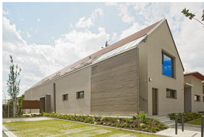
Neu errichtetes Dorfgemeinschaftshaus, Bild: Gemeinde Kühleenthal

lichkeit, schöne Feste in angenehmer Atmosphäre abzuhalten.