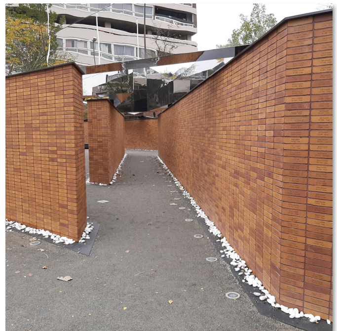
Foto 2: Das Nationaal Holocaust Namenmonument in Amsterdam gedenkt aller von den Nazis ermordeten Juden aus den Niederlanden