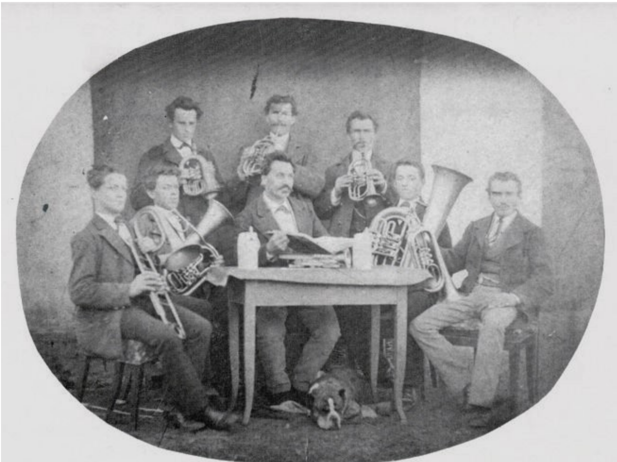
Blaskapelle Unterthürheim um 1880.