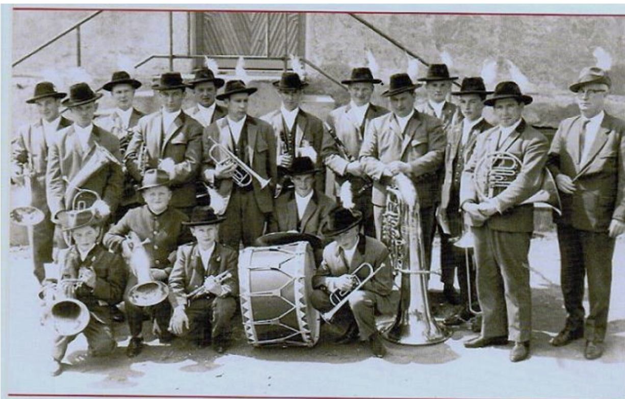
Gründungskapelle 1963 mit Nachwuchsmusikern in Miesbacher Tracht.