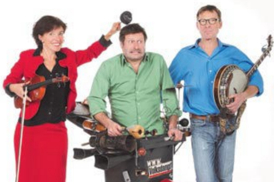
„Schöne Grüße aus dem Hinterhalt“ mit der Gruppe Volksdampf