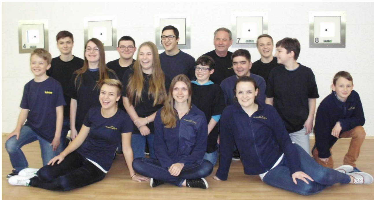
Schützenjugend in den neu renovierten Schießständen 2015