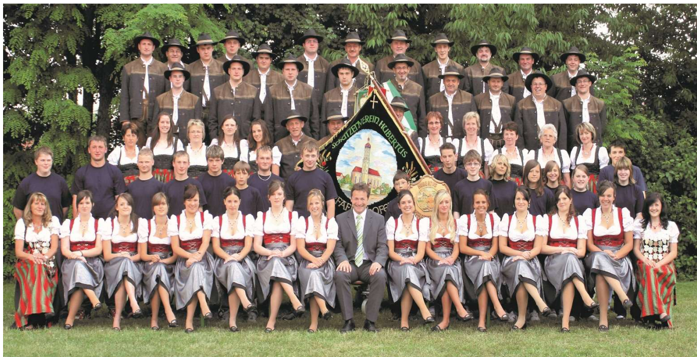
Schützenverein im Festjahr 2008

Einmal im Monat ist bereits am Nachmittag Betrieb im Schützenheim. An diesem Tag treffen sich die Seniorinnen zu Kaffee und Kuchen. Eine Tradition, die schon seit Jahren gelebt wird und sich großer Beliebtheit erfreut. Eine Gelegenheit, bei der sich alle austauschen können und nach einem Abendessen gestärkt den Heimweg antreten.