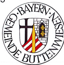
Gudrun Bentele Bauamt

Gemeinde Buttenwiesen Buttenwiesen, den 28.07.2023